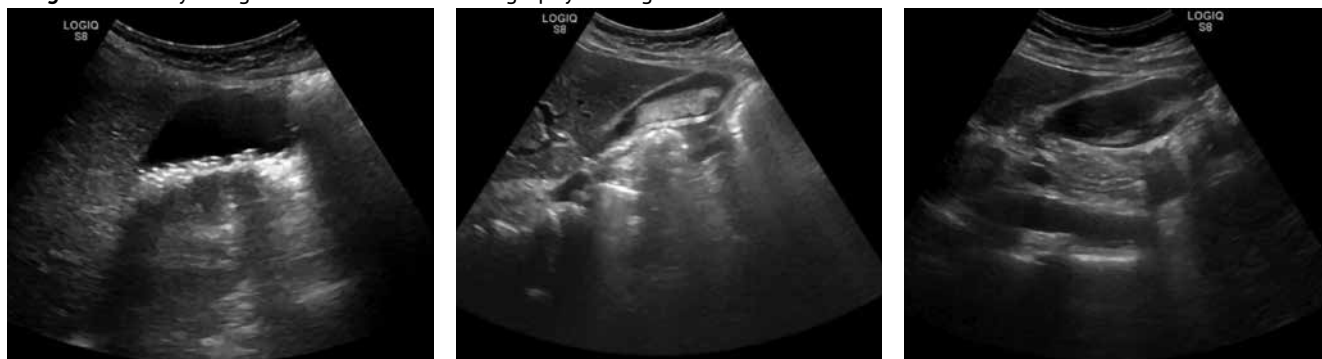
● Рисунок 1. Билиарный сладж по результатам ультразвукового исследования ● Figure 1. Biliary sludge based on the ultrasonography findings

в течение ближайших 2 лет, особенно при соблюдении диетических мероприятий, в 60% случаев исчезает и появляется вновь, а в 6% случаев могут возникать приступы билиарной колики. Исчезновение билиарного сладжа как на фоне консервативной терапии, так и спонтанное позволяет говорить о возможной обратимости ЖКБ на ранних стадиях, что предопределяет некоторые терапевтические подходы.